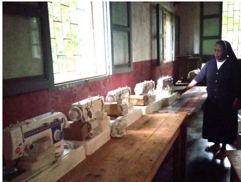
Scuola di cucito a Maromandia