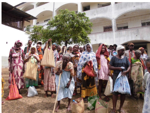
Distribuzione riso ai bisognosi