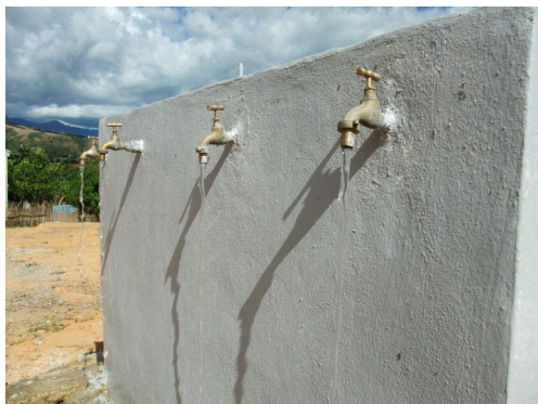
Acquedotto ad Ankaramibe