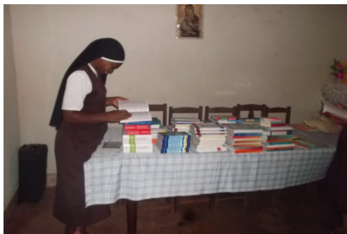
Libri disponibili per gli alunni