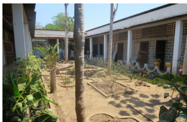
Missione di Maromandia