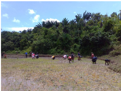
Progetto risaie per il lavoro ed il cibo