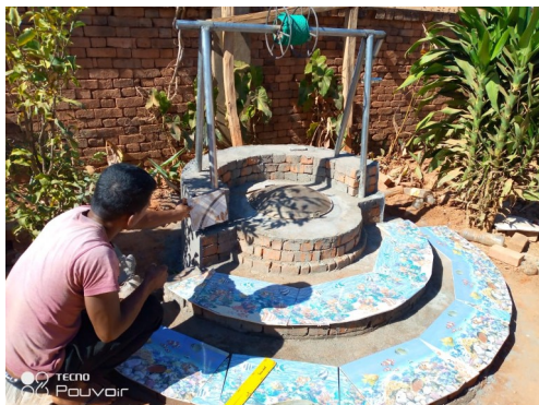
Pozzo a Tsiroanomandidy