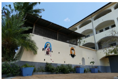
Missione di Santa Theresa

https://bambinidelmadagascartongaso.it/index.html