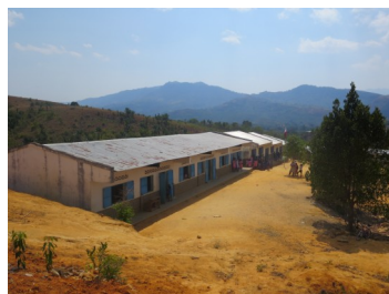
Missione di Ankaramibe